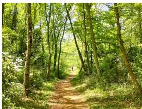
八国山緑地尾根道

出世弁財天女宮 創建は1824年といわれています。湧水の蓮池があって民地を挟んで樹齢700年のケヤキ、600年のカヤの木がある社叢があります。社叢の近くを通りますが中に立入ることはできません