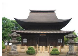
国宝正福寺地藏堂