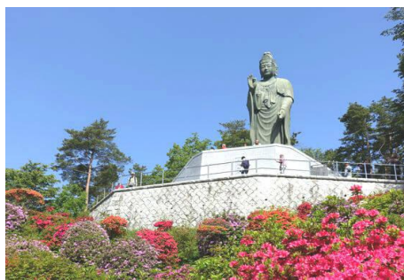
塩船平和観音立像