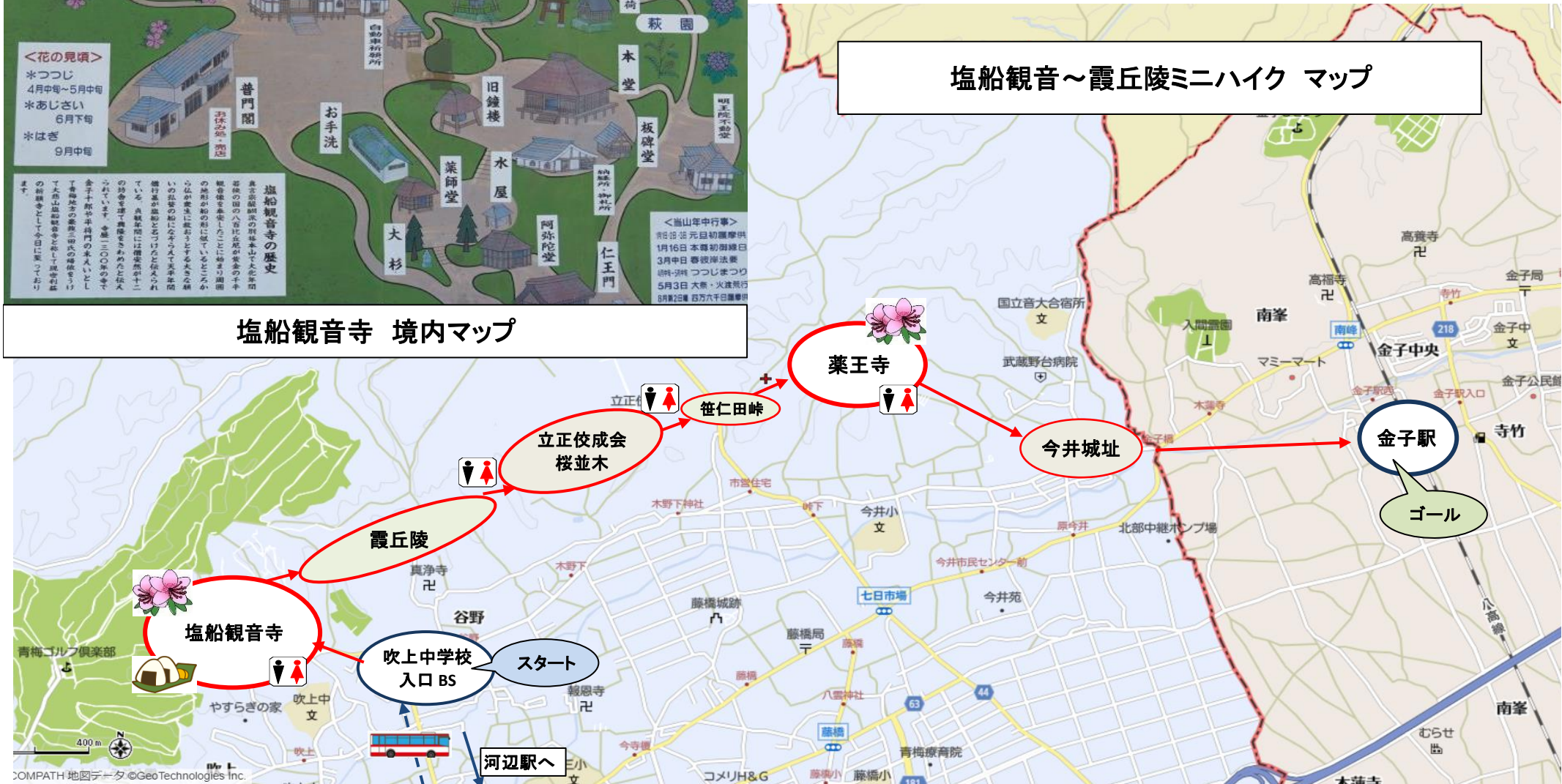
塩船観音～霞丘陵ミニハイク マップ