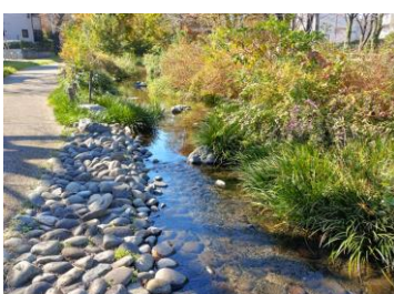
高次処理水のせせらぎの根川緑道