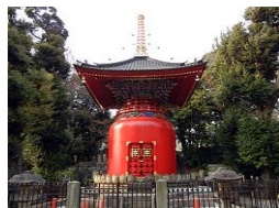
宝塔 (国重要文化財)