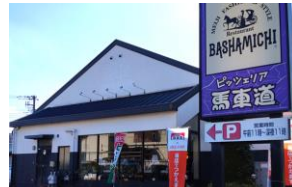
ピッツェリア馬車道