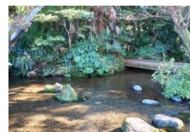
南沢緑地からの湧水の流れ