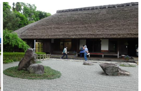
あしがり郷 瀬戸屋敷