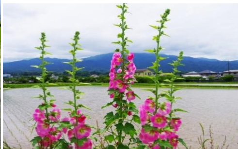
ハナアオイまつり会場