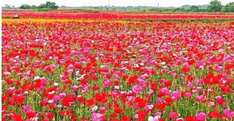
ポピーハッピースクエア