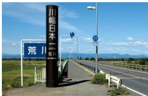
御成橋 川幅日本一の標柱