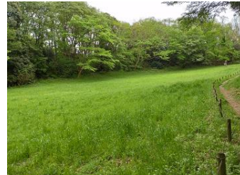
野津田公園みずきの広場