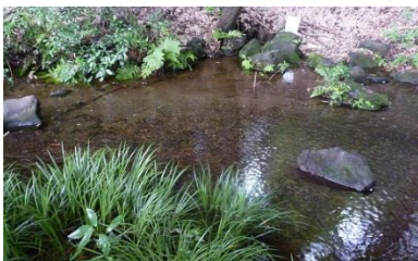
新東京百選竹林公園の湧水

竹林公園.竹林の湧き水 元竹林を公園として整備したもので、3600㎡の竹林には2000本の孟宗竹が茂っています。園内には東京の湧水57選の湧水があり「新東京百景」に選定されています