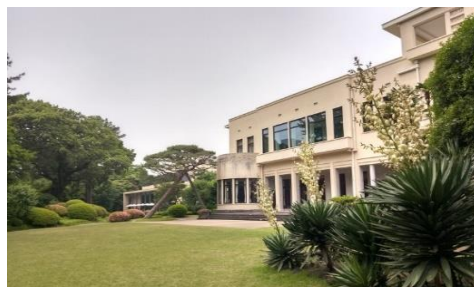
東京都庭園美術館