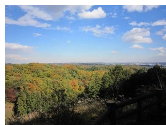
青梅丘陵第一休憩所 筑波山は？