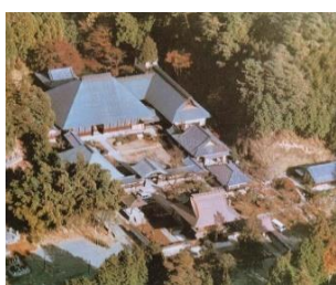
天寧寺七堂伽藍 都指定史跡

金刀比羅神社 御嶽遙拝所からは高年者でも特徴ある大岳山の右に御岳山が確認ok(写真下)