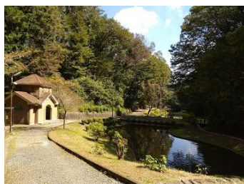
風の子太陽の子広場 建物はトイレ