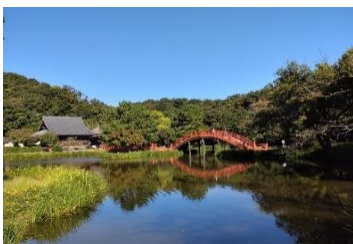
称名寺浄土式庭園