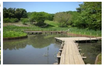
大久保分園 トンボ池(5月)