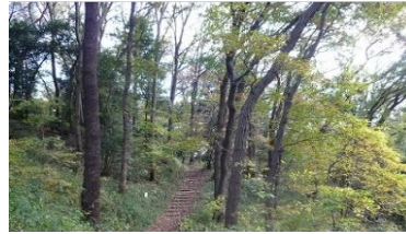
梅木窪分園 尾根道(11月)