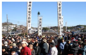
木賊不動だるま市