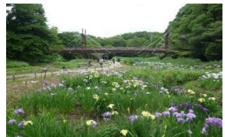
泉の森湿地園 前方は緑のかけ橋