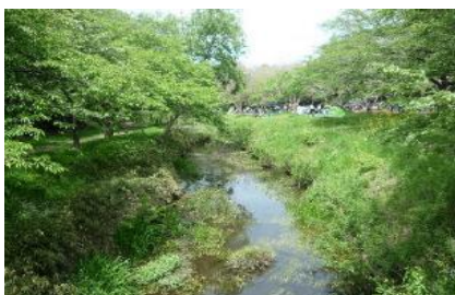
ふれあいの森と引地川

緑の架け橋 湿性植物園の上をまたぐように架けられた全長53m、幅2mの平成3年に完成した木製斜張橋です。橋の上からは園内を一望することができます。平成4年度建設省の「手づくり郷土賞」を受賞し、平成5年度にはアメリカ木造協会木橋部会の「木造橋賞歩道橋部門」において第1位を受賞しました