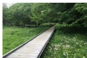
ハケの森自然観察園