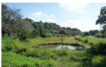
国分寺崖線(左)と野川遊水地

都立武蔵野の森公園 旧陸軍調布飛行場→米軍接收→1974年返還→2000年に都立公園として開園(35ha)。展望の丘からは調布飛行場のプロペラ機の離着陸の様子が見られます。旧陸軍調布飛行場には首都防衛のために新鋭機3式戦闘機「飛燕」が配備されましたが、高度1万mで飛来するB29に対しては戦果はあげられなかったといわれています。空襲から戦闘機を守るための掩体壕が30基ほど造られましたが、2基が保存されています。今回は2号に立寄ります