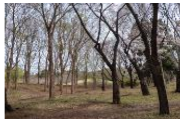
武蔵野公園木立&くじら山