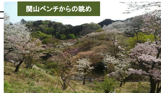
関山ベンチからの眺め