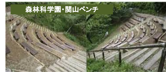
森林科学園・関山ベンチ