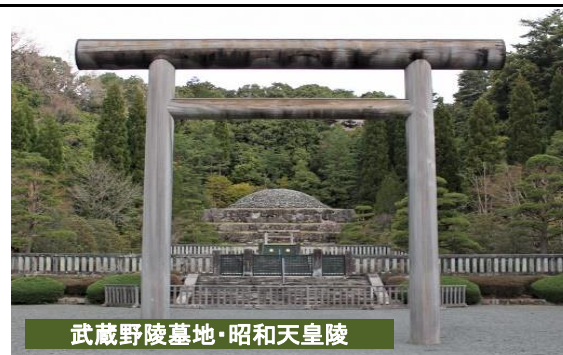
武蔵野陵墓地・昭和天皇陵