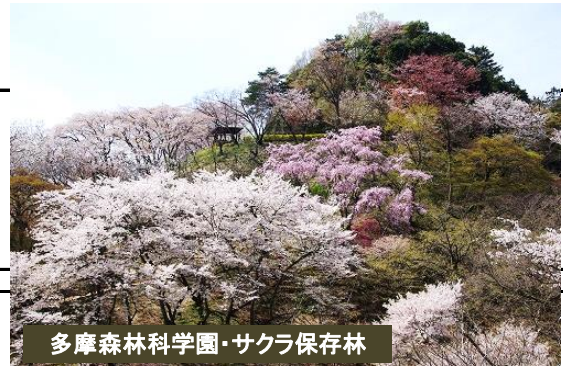
多摩森林科学園・サクラ保存林