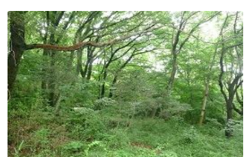
新緑の清水入緑地