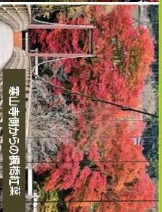
栗山寺側からの楓橋紅葉