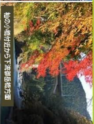
池の小橋付近から下流御岳橋方面