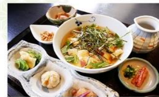
大豆の旨味が際立つままごと風特製おぼろ豆腐にベーコンとかかり揚げをトッピングしました。出し汁あんかけをかけてお楽しみください。 副菜三種、知のお漬、揚げ大豆、香の物、汁飯付