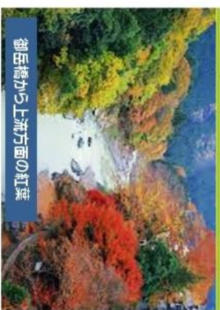
御岳橋から上流方面の紅葉