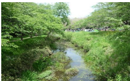
ふれあいの森と引地川

平成4年度建設省の「手づくり郷土賞」を受賞し、平成5年度にはアメリカ木造協会木橋部会の「木造橋賞歩道橋部門」において第1位を受賞しました