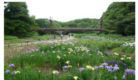
泉の森湿地園 前方は緑のかけ橋