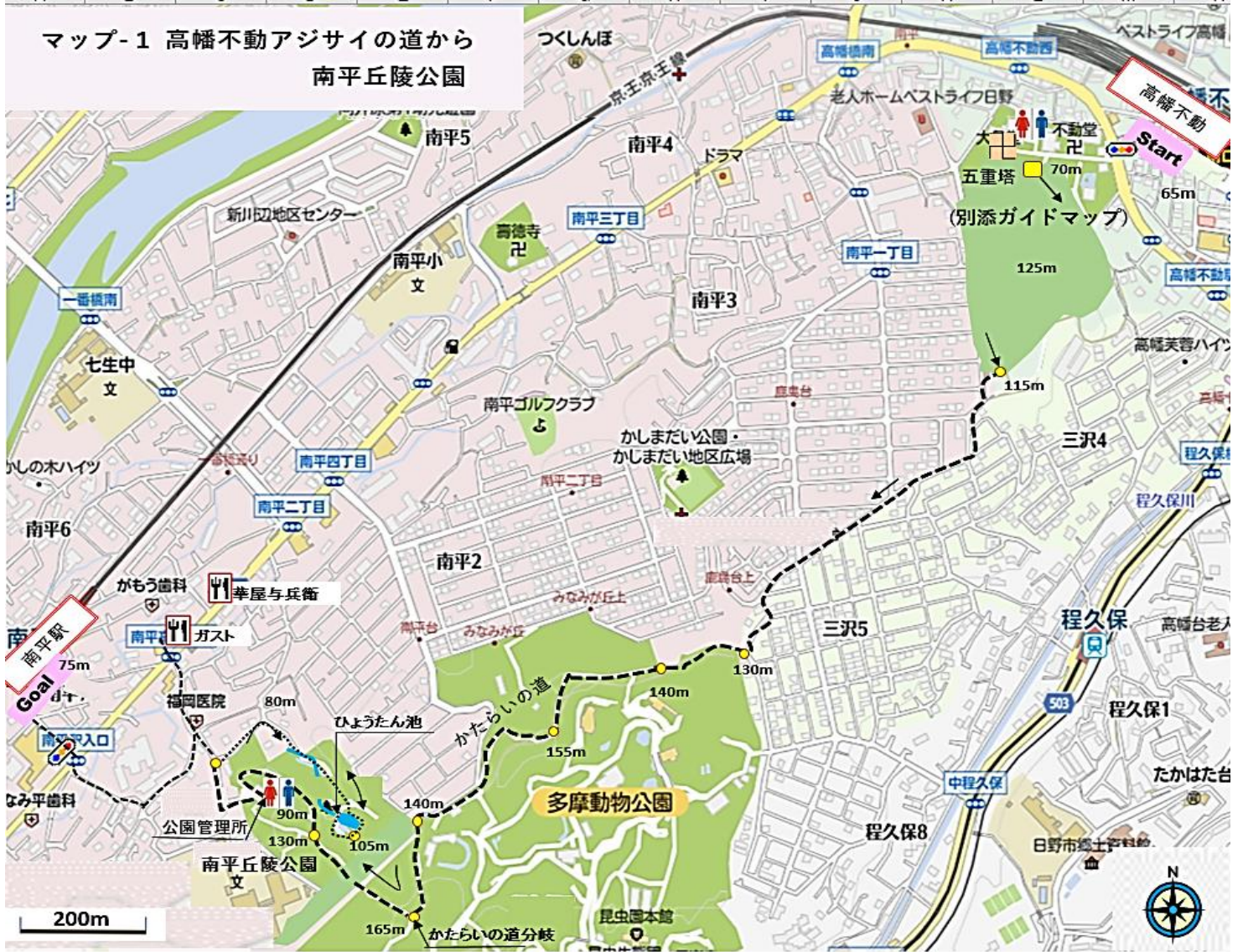
マップ-1 高幡不動アジサイの道から 南平丘陵公園