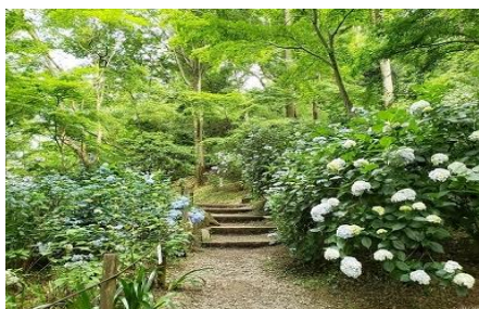
雑木林に混在するあじさいの路

南平丘陵公園 多摩動物公園の北斜面の位置関係にある南平丘陵公園は、丘陵の地形と樹林をそのまま活かした自然公園です。このため、園内の遊歩道は急な木段があるミニハイキングコースです