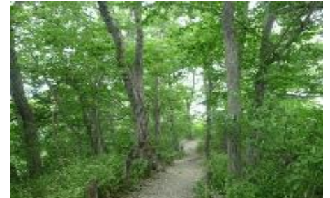
雑木林のかたらいの路