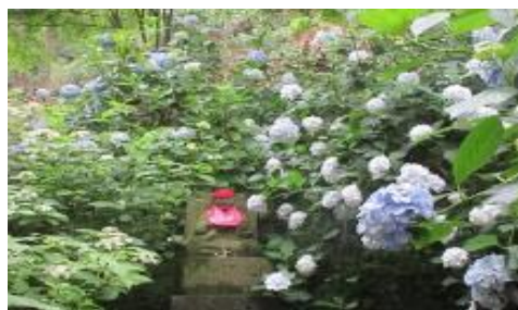
山内八十八カ所の様子