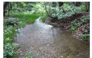
南沢緑地保全地域の流水