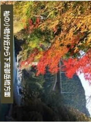
袖の小橋付近から下流御岳橋方面