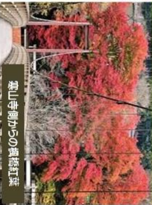
寒山寺側からの楓橋紅葉