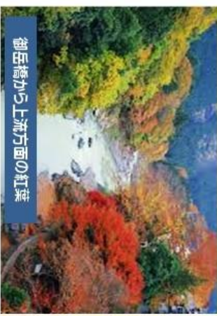
御岳橋から上流方面の紅葉