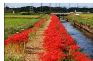
小出川ヒガンバナ群生地