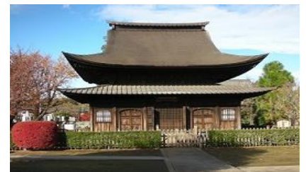
国宝 正福寺千体地藏堂