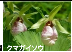
四季の森公園 クマガイソウ