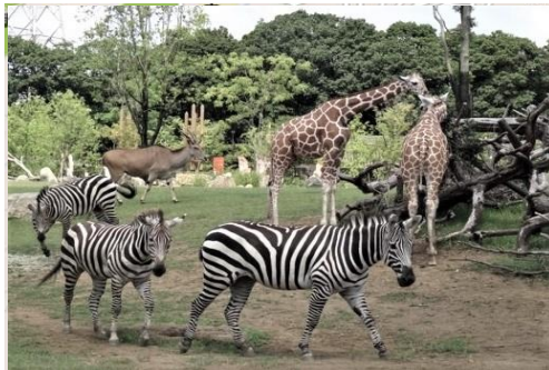
ズーラシア・サバンナゾーン