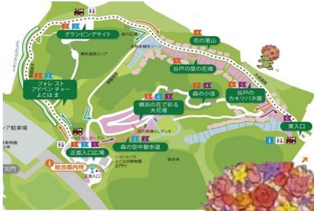
里山ガーデン MAP (ガーデンフェスタ会場)