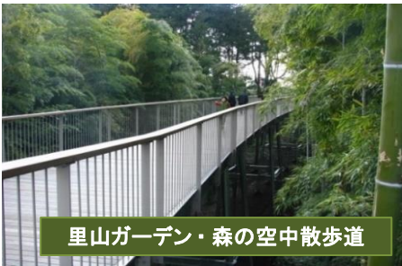
里山ガーデン・森の空中散歩道