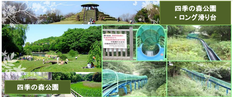
四季の森公園 ・ロング滑り台