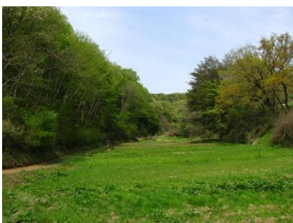
小野路谷戸の布田道

三社大権現跡 三社とは富士、御嶽、大山の神々を祀る社で、いまでは社殿等はありませんが、往時は聖地として独特の雰囲気を持っていたといわれます。滑りがちな木段を下りて行く途中の右側の椎の木の根元に祠が、その先左に地藏尊が往時の姿を残しています