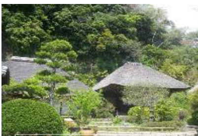
往時の姿を残す明王院

昼食 弁当です。予定地は永福寺跡展望台(比高10m)です。展望台でなく下写真ペンチ利用等は自由選択です