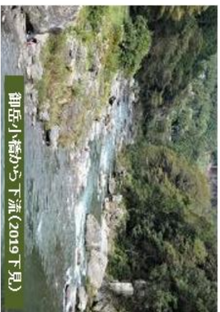
御岳小橋から下流(2019 下見)