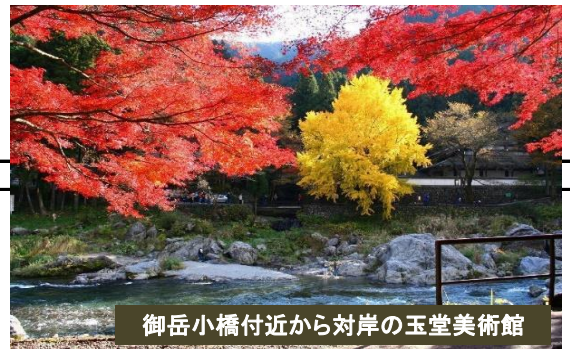
御岳小橋付近から対岸の玉堂美術館