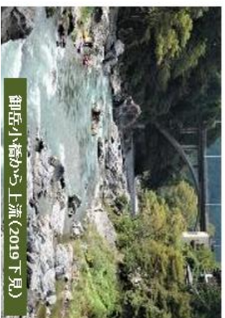
御岳小橋から上流(2019 下見)