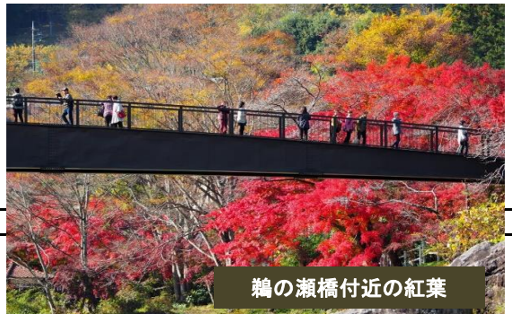
鶴の瀬橋付近の紅葉