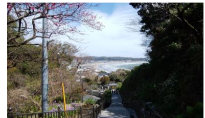
アジサイがなくなった成就院参道