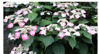
光則寺ヤマアジサイ