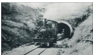
往時の 軽便 鉄道

◆ トトロの森 狭山丘陵の雑木林の里山を残すために、1990年よりナショナルトラストによる買い取り運動が展開され、トトロの森という愛称で保全されています。現在9億4千万円の寄付金とトロ48号地まで誕生しています。今回は、28号地に続く堀口天神社から1号地～3号地へ緩やかな下りの雑木林を歩きます となりのトトロのモデル地は狭山丘陵の八国山といわれていますが、TVでは堀口天神はトロが遊んだ舞台となったところ