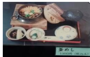
釜めし 100円 (税込)