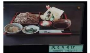
天もりそば 100円 (税込)