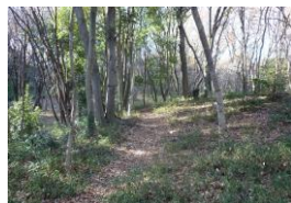
ト トロ の 森 1 号