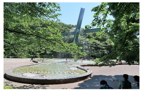
芹ヶ谷公園の虹と水の広場