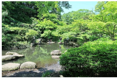
芹ヶ谷公園の池の風景