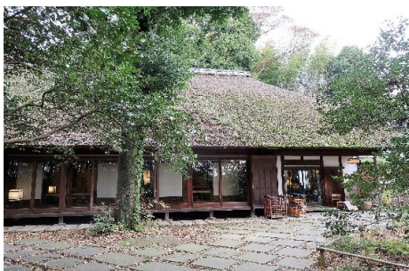
白洲次郎旧宅武相荘ミュージアム