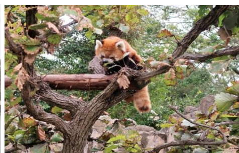
野毛山動物園のレッサーパンダ