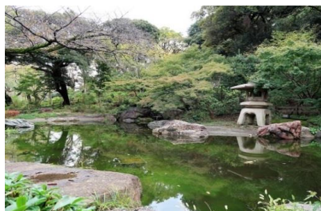
掃部山公園の日本庭園の眺め