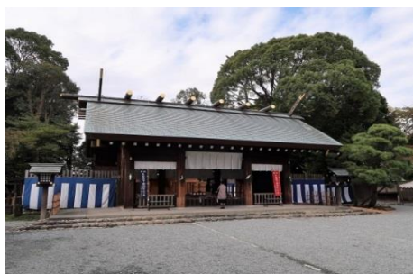
神明造の伊勢山皇大神宮