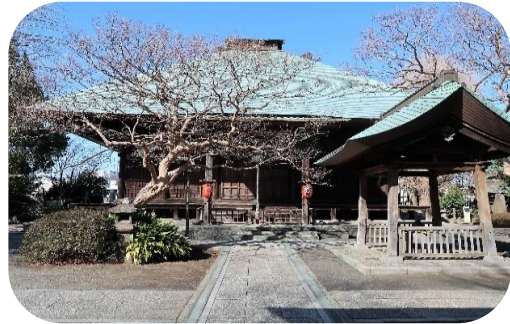
影向寺の薬師堂(本堂)