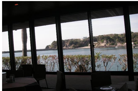
レストラン シーボニア