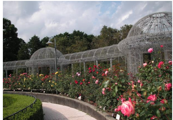
小田原フラワーガーデン