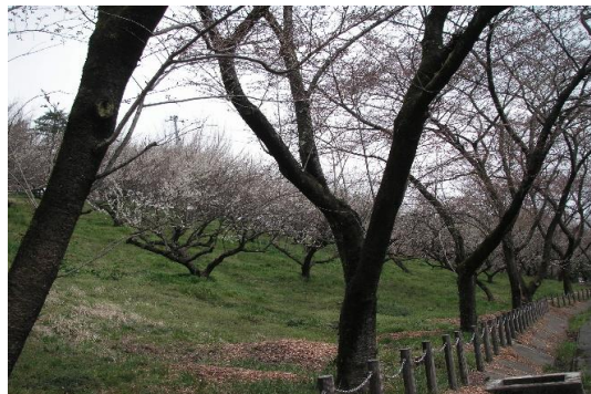
コミュニティー広場の梅