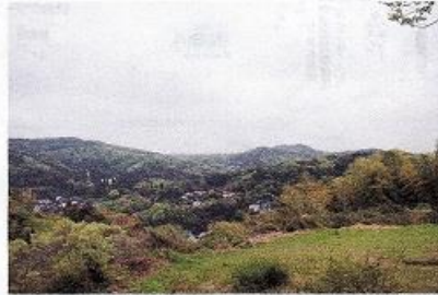
台峯緑地からの眺め