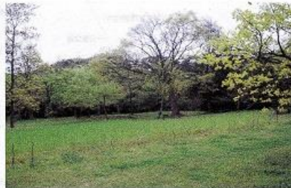
鎌倉中央公園 疎林広場