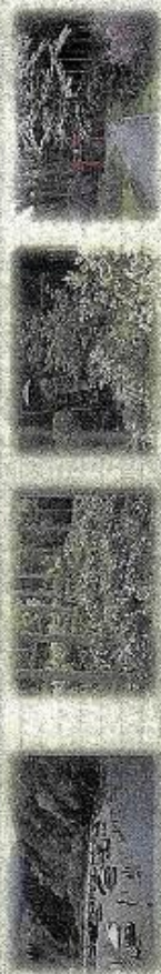
①秋川橋川公園のランド (6月下旬) ②深沢南沢あじさい山 (6月下旬) ③大悲観寺 白萩 (9月中旬) ④冲天山 葉つつじ (3月中旬)