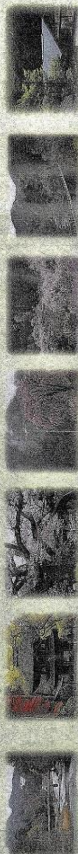
⑤小和田橋 新緑・紅葉 (11月下旬) ⑥広徳寺 大観音紅葉 (11月下旬) ⑦光厳寺 山桜 (4月中旬) ⑧地珠院 したれ桜 (3月下旬～) ⑨乙仲花の里 桜・葉つつじ (4月上旬) ⑩石舟橋～兼吉の湯 新緑・紅葉