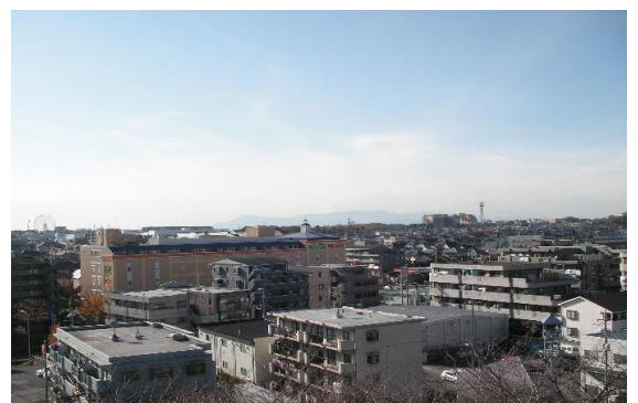
山田富士公園高台