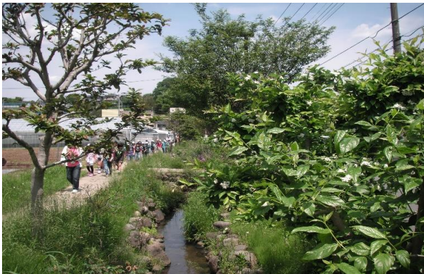
小川アメニティー