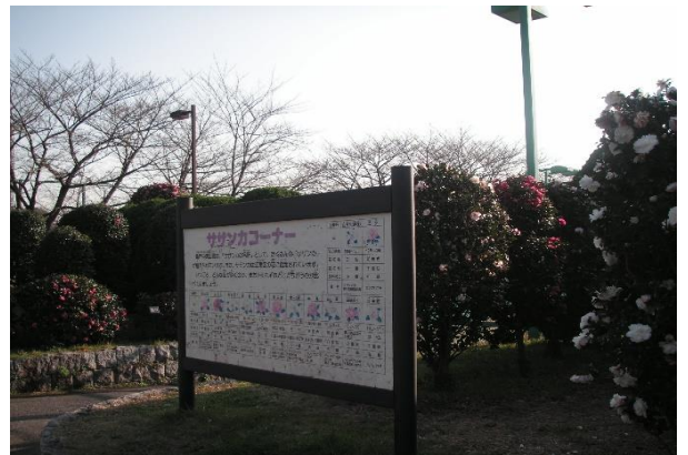
亀戸中央公園 サザンカ