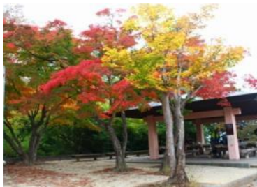
17.10.31日 山頂の紅葉の様子