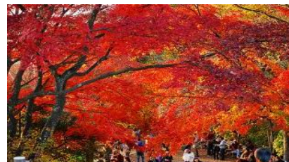
薬王院の紅葉と人混み