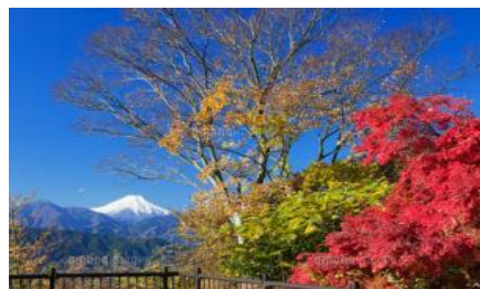
高尾山山頂 ラッキーな眺め