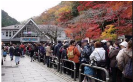
ケーブルカー 待つより歩く方が早い?