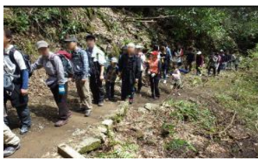
すれちがいの際は山斜面側に避けて対向者を通す