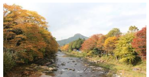
佳月橋から岩瀬峡