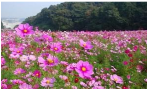
くりはま花の国 コスモス畑