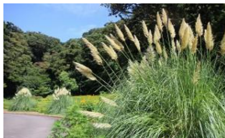
くりはま花の国 パンパスグラス