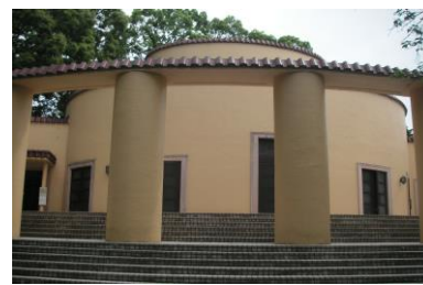
桜ヶ丘公園 聖蹟記念館