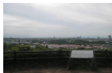
よこやまの道 展望広場