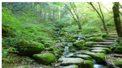
飛石で溪流を縫いながら歩く