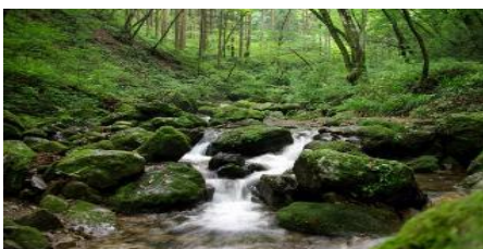
東京の奥入瀬と呼ばれる

・例年のレンゲショウマの見ごろは盂蘭盆のころですが、その年の気象により変わります