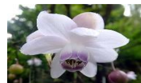
花はレンゲ(蓮)に 葉はサラシナショウマに似ている →レンゲショウマ