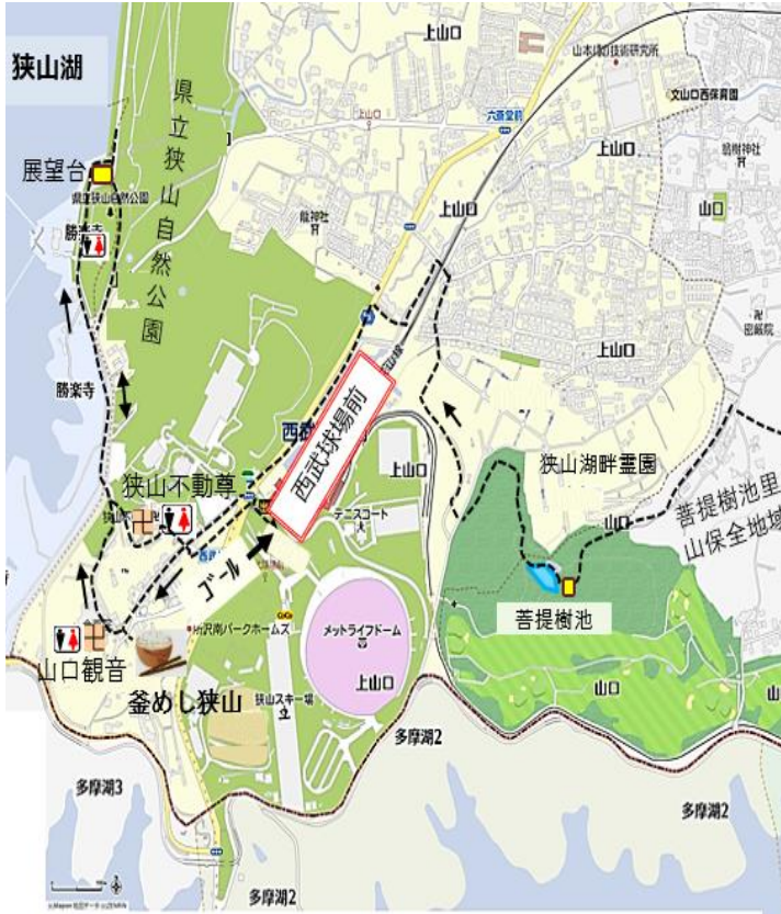
18-5 多摩湖から狭山湖マップ