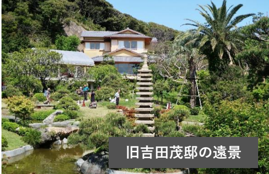
旧吉田茂邸の遠景