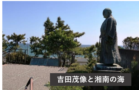
吉田茂像と湘南の海