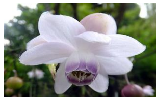
レンゲショウマの花は蓮華に、葉はサラシナショウマに似ている → レンゲショウマ